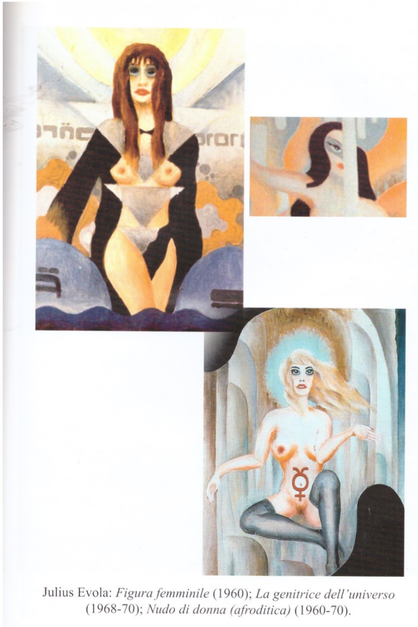
Julius Evola: Figura femminile (1960); La genitrice dell'universo (1968-70); Nudo di donna (afroditica) (1960-70).

nel particolare, l'infinito nel frammento, l'armonico nella lacerazione.