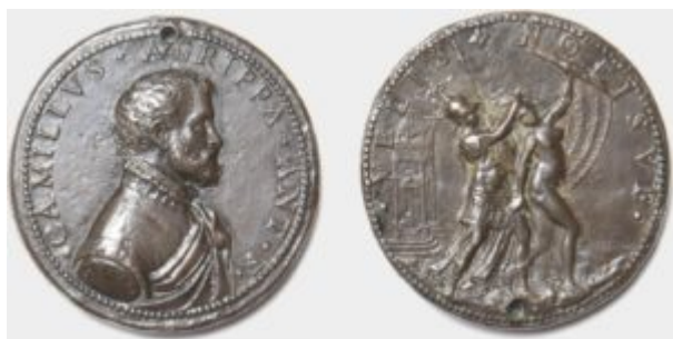
figura femminile con vela simboleggia la Dea Fortuna, mentre: « Nella figura in armi [...] era stato identificato un guerriero, da intendersi come ipostasi dello stesso Camillo » (p. 54). In realtà, stando alla

La figura nuda avanza a passo celere verso sinistra, tenendo con la mano mancina una vela. Sul fondo della rappresentazione appare un edificio che potrebbe essere un tempio o un faro. Intorno alla medaglia corre la scritta Velis Nolisve . La