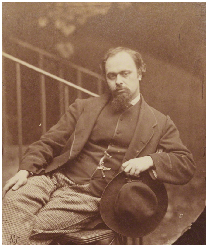
(Dante Gabriele Rossetti)