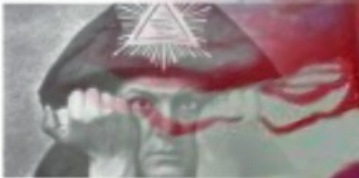
Aleister Crowley, "Yonos più oculto" (1911)

1. L'inglese Aleister Crowley (1875-1947) è noto in Italia soprattutto per gli aspetti della sua magia rossa, che praticò nell'Abbazia da lui edificata in Sicilia, a Cefalù (in Contrada Santa Barbara), seguendo le indicazioni di un oracolo cinese. Era la fantascienza Thele-