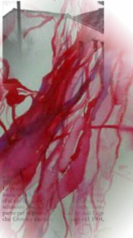
figura suscitò interesse per il suo eclettismo, il sapere transculturale, il desiderio di stupire anche attraverso i travestimenti. Assunse pseudonimi allisonanti: come l'identità de La Bestia 666, profetizzata dall'Apocalisse, significante l'Anticristo che avrebbe distrutto il Cristianesimo.

Nella letteratura tantrica il corpo della sacerdotessa possiede zone di energia occulta, intimamente correlata con le ghiandole endocrine. Queste generano fluidi e vibrazioni che fuoriescono dall'apertura delle sue bocche di fuoco, come quella genitale. La conoscenza di questo uso energetico del corpo della donna è "usata" nei rituali delle sacerdotesse del Taoismo. Crowley, in Boca do Inferno , un suo acquerello su carta del 1931, scrive all'amante: «Io non posso vivere senza di te. L'altra bocca d'inferno mi avrà, ma non sarà tanto calda come la tua».