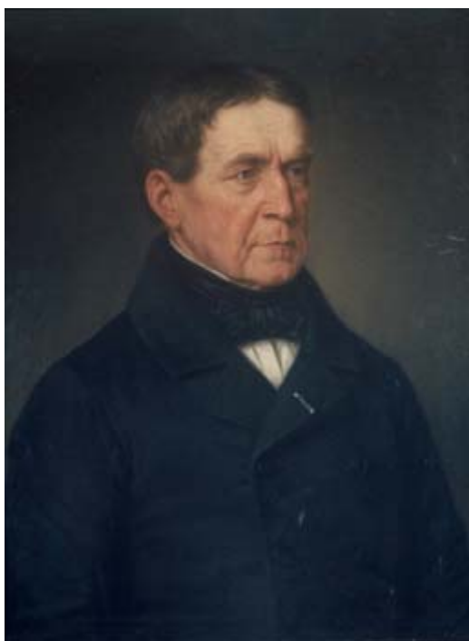
(Franz von Baader)

sé: « il loro rapporto si instaura in un descensus-ascensus reciproco, come quiete nel movimento e movimento nella quiete » (p. 22). L'una non può stare senza l'altra, in quanto il femminile si unisce al femminile nel maschile, e il maschile al maschile nel femminile, durante il processo generativo. La visione gravitazionale moderna ha sterilizzato la vita del cosmo assolutizzando il momento maschile, "calcinandolo" nel suo fuoco espansivo ridotto a mera dispersione. Di contro, il principio femminile ha finito per imputridire, nell'isolamento, dando luogo alla stagnazione dell' "acqua di vita".