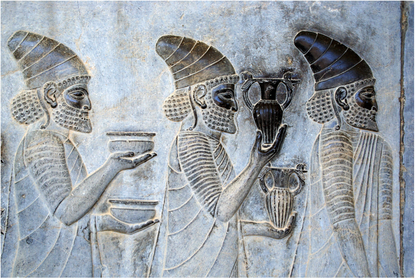
(Figura 5 – Gli Armeni offrono il loro vino al sovrano achemenide)

È in questo periodo che la stella dei Magi compare come un astro a cinque punte: troviamo questo tipo di descrizione in due formelle facenti parte della Cattedra d'avorio di Massimiano, conservata al Museo Arcivescovile di Ravenna e risalente a questo periodo. Una stella a otto punte guida invece i magi anche nei già citati mosaici di Sant'Apollinare Nuovo risalenti all'epoca giustiniana, ovvero la seconda metà del VI secolo. Seguendo le trasformazioni iconografiche, la stella dei Magi diventa una cometa soprattutto grazie a Giotto che rimane colpito dal passaggio della cometa di Halley nei cieli del 1301. La raffigurazione della cometa nell'Adorazione e nel Viaggio dei Magi da Giotto in avanti, porta dunque con sé la testimonianza di un evento astronomico occorso nei cieli del 1301 di cui il pittore, grande naturalista, ritrasse la memoria. Questo motivo non poteva essere tratto dalla letteratura antica o medievale in quanto l'astrologia antica, medievale e finanche al Seicento, ha sempre considerato il