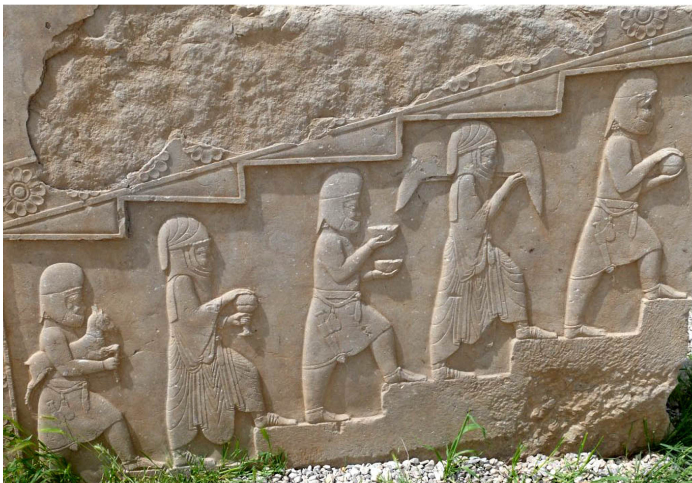
(Figura 4 – Processione dei Magi sulla scalinata di Persepolis)

artisti e i committenti pensassero con sicurezza alla provenienza persiana dei Magi più di quanto non accadesse nelle fonti scritte coeve o precedenti. Gli esempi portati sinora convergono nella direzione che l'astro della pericope di Matteo e soprattutto quello degli scritti apocriefi coevi o di poco posteriori, possa identificarsi con una Grande congiunzione di Giove e Saturno.