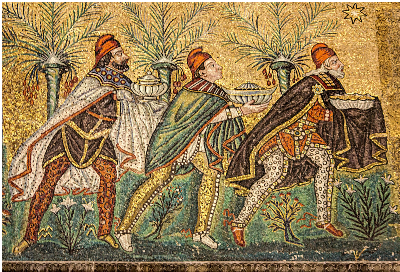
(Figura 1 – Adorazione Magi Ravenna)

Al centro dell'attività sacra e predittiva dei Magi c'è la conservazione e la salvaguardia del mondo che si associa alla celebrazione dell'istituto della regalità ed al suo mantenimento. Schermo privilegiato delle osservazioni dei Magi è il cielo in cui si riproducono di continuo i movimenti di stelle, pianeti, luminari, e comete. La millenaria cultura mesopotamica aveva fornito ai sapienti iranici il patrimonio di sapere attraverso il quale leggere il firmamento e il mondo. La sintesi tra iranismo e cultura mesopotamica fu molto significativa e contribuì alla codificazione di tecniche e di linguaggi semiologici nell'interpretazione degli eventi siderali, atmosferici e ambientali al fine predittivo, conoscenze che erano riservate a una ristretta cerchia di specialisti ed interpreti. L'alto grado di specializzazione di questa élite in ambito astronomico e astrologico, le sue differenziate categorie di professionisti e osservatori delle stelle e del cielo, contribuì alla fama secolare dei Magi e ci