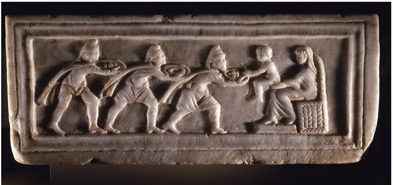
(Figura 3 – Adorazione dei Magi capsella Santi Quirico e Giulitta)

e allora «la raccolsero, la baciaron con devozione, se la posero sugli occhi e sulla testa in segno d'adorazione e la riposero quindi fra i loro tesori»[10]. La presenza di elementi della tradizione zoroastriana è già notevole in questo racconto ma i contatti tra i Magi evangelici e la Persia si fanno ancora più stringenti nella versione siriana dove si narra che «nella notte stessa della nascita di Gesù, un Angelo fu inviato in Persia dove si stava celebrando una grande festa e i magi, adoratori del fuoco e delle stelle, erano addobbati di paramenti solenni»[11]. I Magi si misero poi in viaggio seguendo la luce di una stella che si era levata sulla Persia e brillava sulle loro teste. I loro re gli domandarono cosa significasse questo prodigio ed essi risposero loro: «è nato il Re dei Re, il Dio degli Dei, la Luce delle Luci: ed ecco un prodigio divino è venuto ad annunziarci la Sua nascita, affinché noi andiamo ad offrirGli doni e ad adorarlo»[12]. Il testo procede raccontando il medesimo episodio della fascia che abbiamo trovato nella traduzione latina dall'arabo ma aggiungendo un particolare notevole: i magi sono «principi» e «figli dei re di Persia».