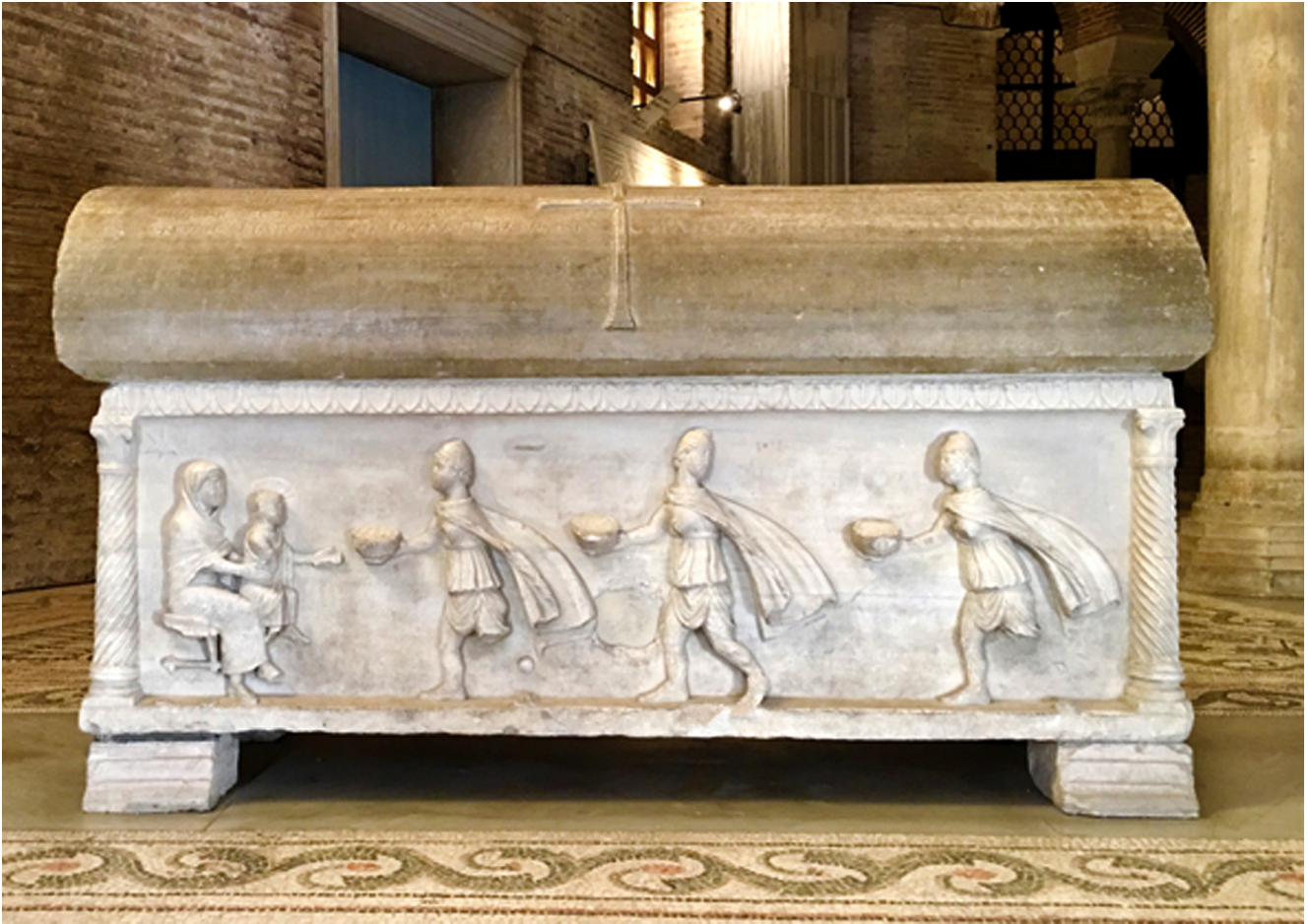
(Figura 2 – Sarcofaco esarca Isacio)

segno all'altro per poi iniziare nuovamente dal primo.