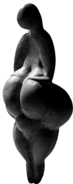
7 – Venere di Lespugue, Pirenei, Francia ~ 25.000 a. C.