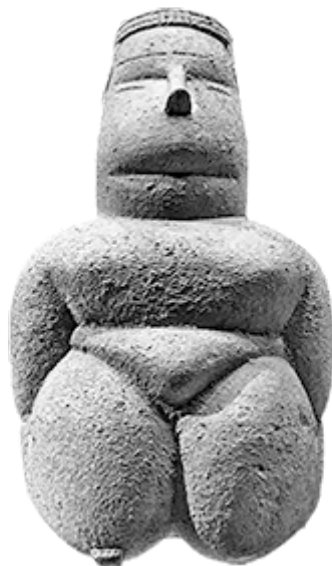
1 – Dea madre di Cuccuru S'Arriu, 46 – Dea madre, Kostenki, Russia, Cabras, Sardegna, V mill. a. C.