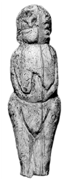
8 – Venere di Mal'ta, Siberia, Russia, ~ 28.000 a. C.