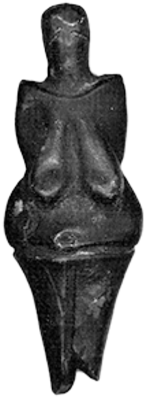
4 – Venere di Dolni' Ve'stonice, Moravia – Repubblica Ceca, ~ 24.000 a. C.