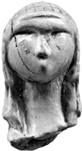
9 – Venere di Brassempouy, Aquitania, Francia, ~ 20.000 a. C.