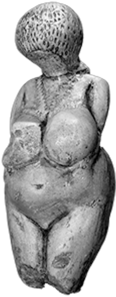
2 – Dea madre, Kostenki, Russia ~ 25.000 a. C.