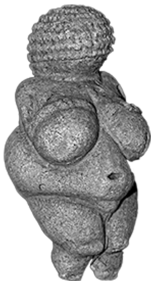
6 – Venere di Willendorf, Austria, 23.000-19.000 a. C .