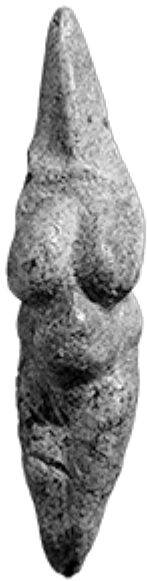
5 – Venere di Savignano, Savignano sul Panaro, Italia ~ 28.000 a. C.